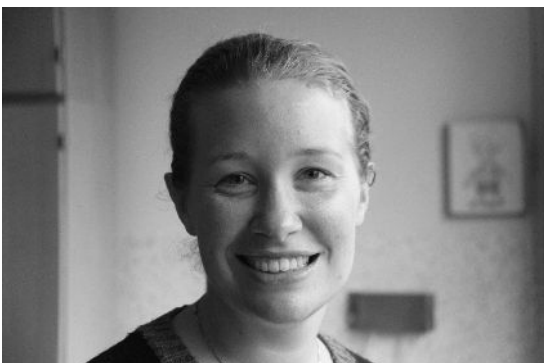
Dit is de stagiaire.