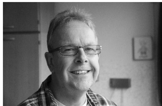
Dit is mijn dokter.