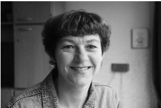
Dit is mijn schoonzus, zij is mijn vertegenwoordiger.

Ik wil niet dat iedereen alles van mij weet!