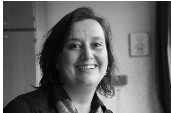
Dit is mijn begeleider.