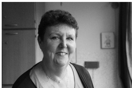
Dit is mijn moeder, zij is mijn vertegenwoordiger.