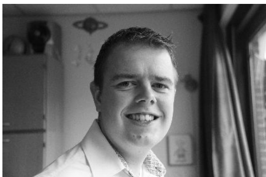
Dit is mijn begeleider.